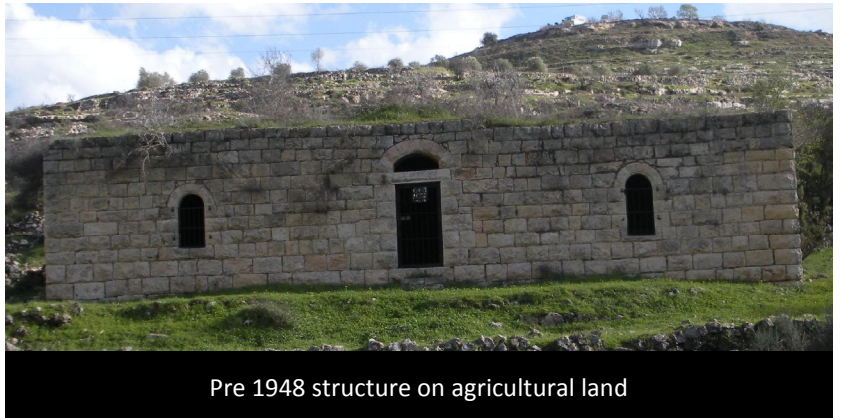
Pre 1948 structure on agricultural land